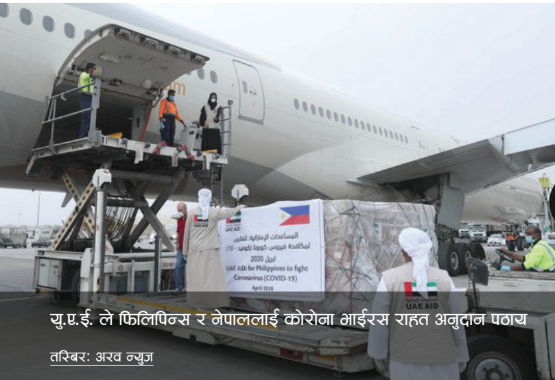
यु.ए.ई. ले फिलिपिन्स र नेपाललाई कोरोना भाईरस राहत अनुदान पठाउ

Coronavirus CivActs Campaign (CCC) ले सरकार, सञ्चार माध्यम, संघसंस्था र आम नागरिक बिचको सूचनाको दुरी कम गर्न देशभरिबाट संकलन गरिएका हल्ला, नागरिकका जिज्ञासा तथा प्रश्नहरू संकलन गरी तथ्य पत्ता लगाएर आम नागरिकलाई सूचित गर्दछ । यसले आम नागरिकका आवश्यकताको पहिचान गर्नुकासाथै हल्लाहरूले कुनै नकारात्मक असर पुऱ्याउनुपुर्व सान्दर्भिक तथ्य आम नागरिक समक्ष प्रवाह गरी जोखिम न्युनिकरण गर्दछ ।